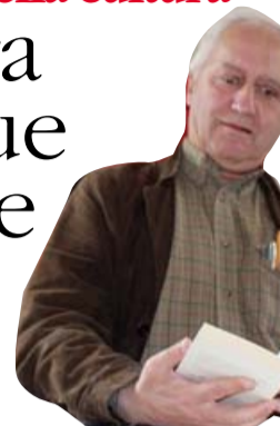
L'urbanista inglese Landry

Ecco cosa fanno le altre candidate Venezia snobba. Oggi arriva Landry