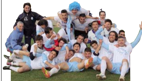
La festa del Metapontino per la D

Il Metapontino compie il salto in Serie D